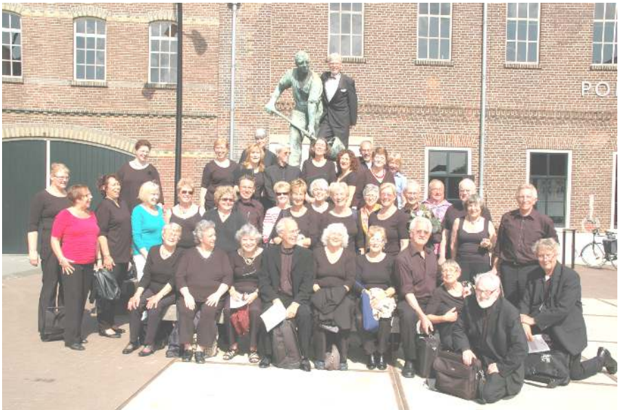
Het Mispagekoor bij de "Gieter".