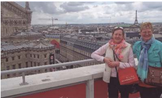
Op de vijfde verdieping van Lafayette

We zouden daarna nog een stadsrit maken in het donker en in de regen. Het weer was wisselvallig met een temperatuur van ongeveer 17 graden, en natuurlijk had ik de paraplu thuis gelaten. Of er in Frankrijk geen regen bestond.