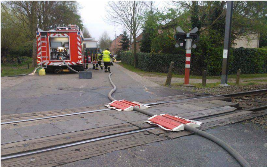
De Belgische brandweer in actie