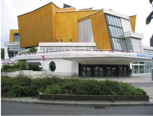
Het gebouw van de Berliner Phil- harmoniker