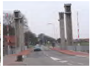
Brug nr. 6