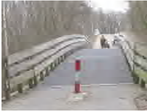
Brug nr. 1