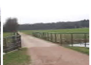
Brug nr. 12