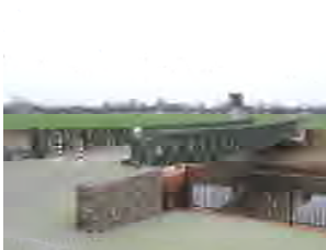
Brug nr. 4