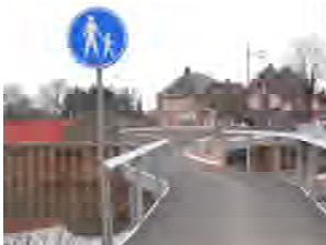
Brug nr. 7