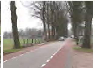
Brug nr. 9