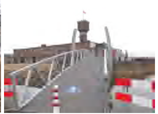
Brug nr. 3