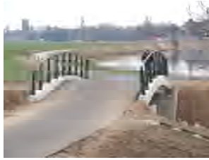
Brug nr. 2