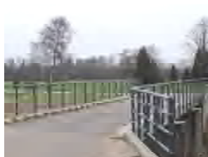
Brug nr. 11