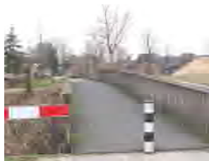
Brug nr. 5