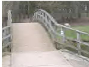
Brug nr. 8