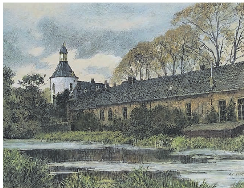
De Zwanenburg in Megchelen voor de afbraak.