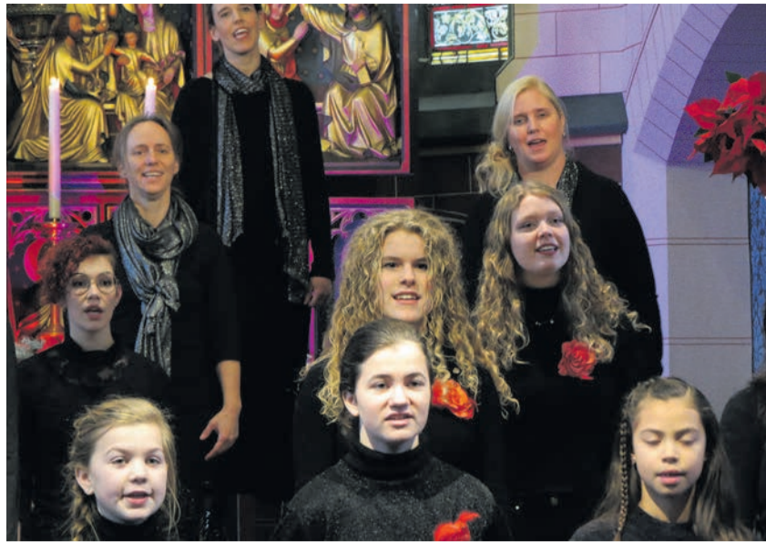
De Ulftse Nachtegalen brengen dit jaar graag weer live hun sprankelende kerstrepertoire.

Op zaterdag 17 december zingt het Kinderkoor vanaf 16.30 uur bij 'Kerstmuziek in de Stad', in de Catharinakerk in Doetinchem. Op zaterdag 24 december doet