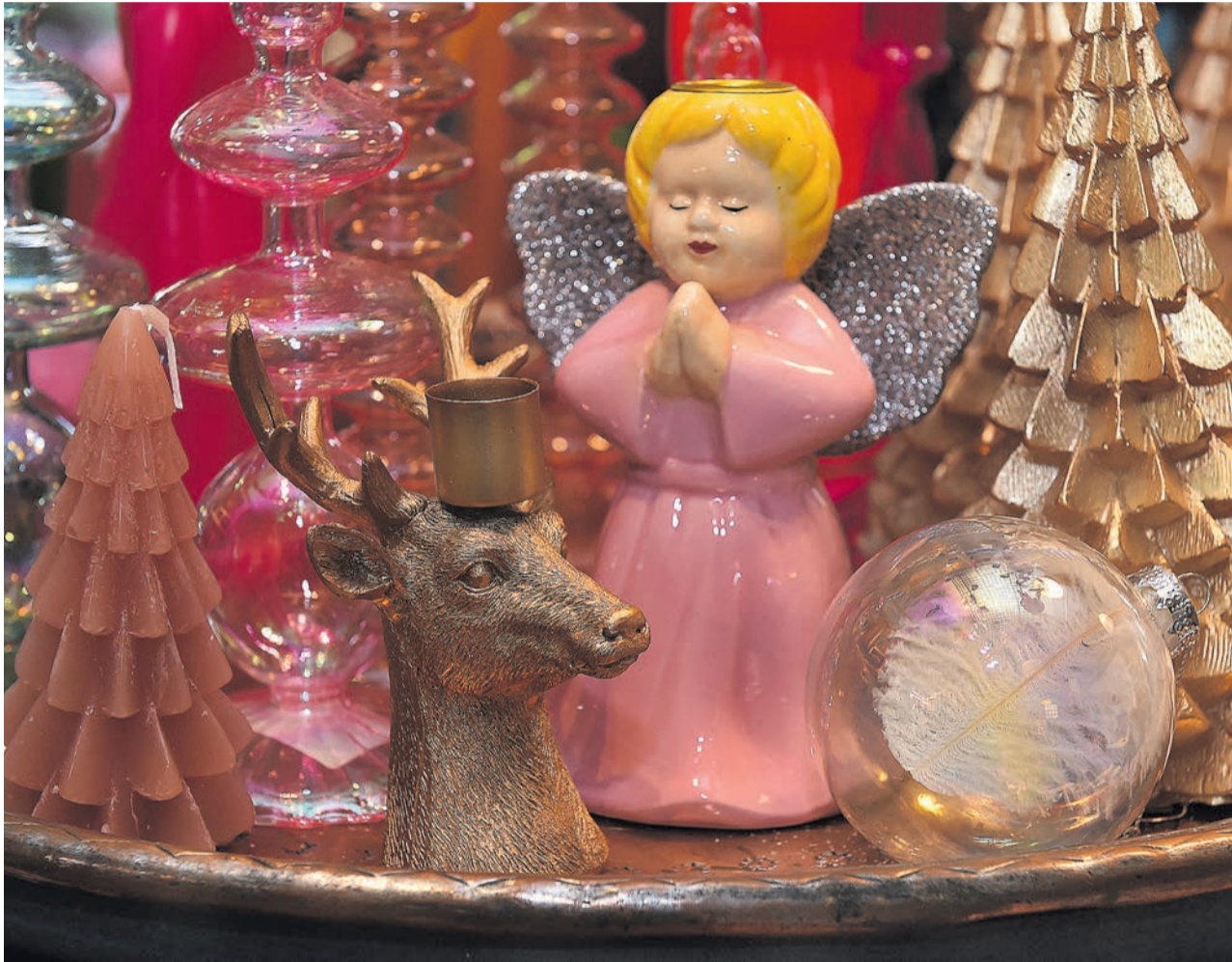
Kerstsfeer bij Studio Marneth.

Sinterklaas is inmiddels alweer een weekje in het land – ook in Ulft heeft de goedheiligman voet aan wal gezet – en de donkere dagen voor Kerst doen langzaam maar zeker hun intrede. Het is dan ook de moeite waard om voor de feestdagen ook thuis wat licht in de duisternis te brengen en gezelligheid en een warme sfeer in huis te halen, nu de dagen korter worden in de aanloop naar Kerstmis.